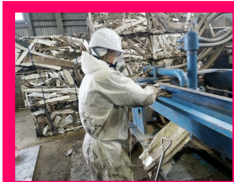
ベラーの清掃作業