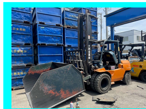
点検作業後のフォークリフト2