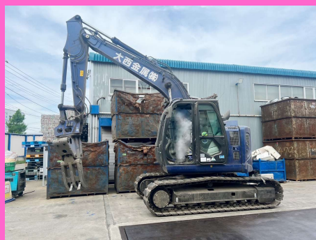
点検作業後のユンボ