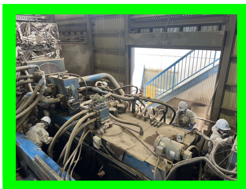
金属破片除去作業