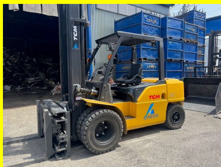
点検作業後のフォークリフト